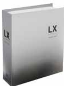
ECOS LX-1000 SERIES バインダー形式 見本帳

株式会社スミノエ（大阪府大阪市 代表取締役 社長：沢井克之）は2月13日（月）、「ECOS（エコス）LX-1000」シリーズに新柄「ECOS LX-1800 TIDE（タイド）」1柄20配色を追加し、新しいバインダー形式の見本帳「ECOS LX-1000 SERIES」に掲載して新発売いたします。